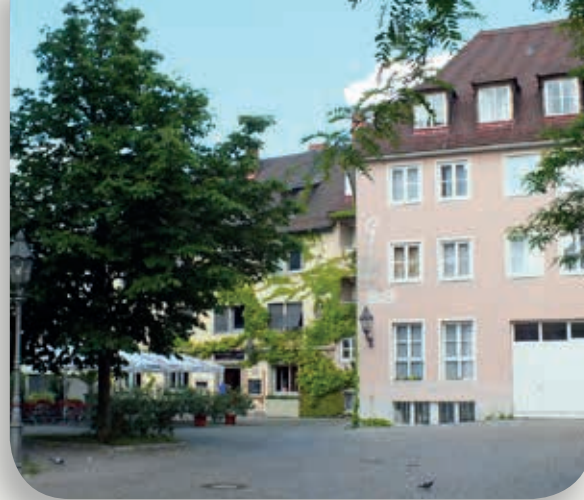
Rückansicht Langzeitwohnheim Haus Gertrud mit Biergarten

Das Leben in der Pleich bietet viele Vorzüge, wie unmittelbare Nähe zur Fußgängerzone, gute Verkehrsverbindungen, Grünflächen und Parkanlagen in der nahen Umgebung.