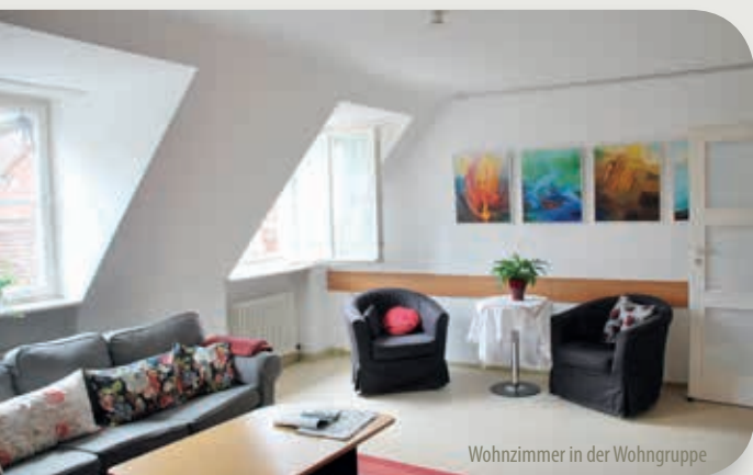
Wohnzimmer in der Wohngruppe

Im Dachgeschoß des Langzeitwohnheimes Haus Gertrud besteht eine selbständige Wohngruppe mit 4 Plätzen. Diese Wohnform erfordert eine erhöhte Eigenverantwortung und Selbständigkeit. Die Betreuung findet dort am Vormittag statt. Darüberhinaus leistet das Langzeitwohnheim flexibel notwendige ergänzende Betreuung.