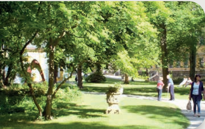
Park des Juliuspitals in unmittelbarer Nachbarschaft

Desweiteren sind für das Wohnheim eine Ärztin für Psychiatrie, Neurologie und Psychotherapie und ein Diplompsychologe beratend tätig.