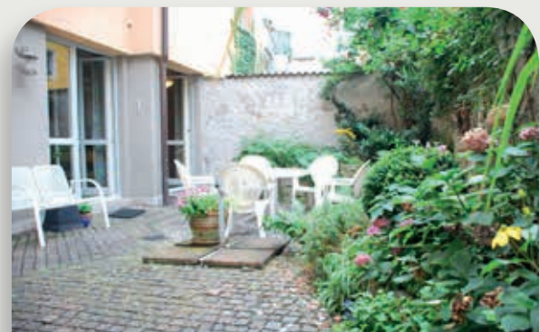
Innenhof im Kleinheim

In räumlicher Nähe zum Langzeitwohnheim befindet sich das Kleinheim Bärengasse mit 9 Wohnheimplätzen.