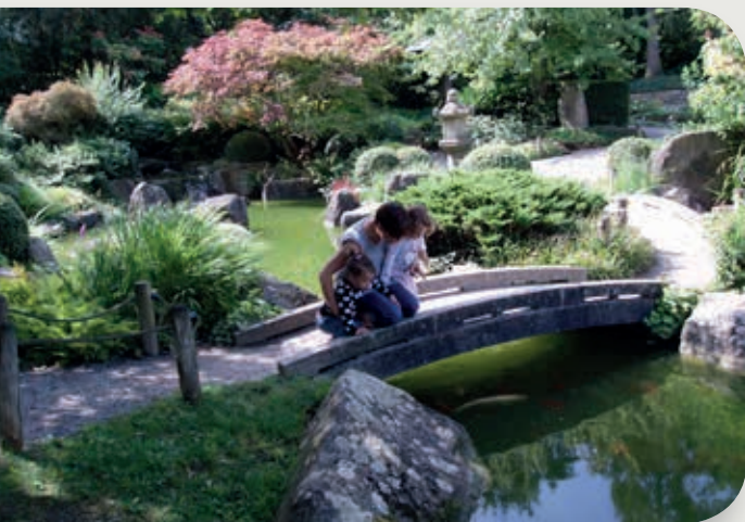
Ausflug zum Wasserspielplatz in unmittelbarer Nähe

Der Stadtteil Zellerau bietet in unmittelbarer Nähe vielfältige Einkaufsmöglichkeiten, Ärzte, einen Wasserspielplatz, die Grünflächen am Main und eine gute Verkehrsanbindung in die Innenstadt.