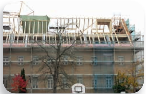
Der neue Dachaufbau des THSJ

Die Arbeiten begannen im Juni 2014. Nach intensiven Abbrucharbeiten wurde das Dach vor dem Winter wieder geschlossen. Zurzeit laufen die Ausbauarbeiten im Innenbereich. Der Rück-Umzug in das sanierte Gebäude ist für August 2015 geplant.