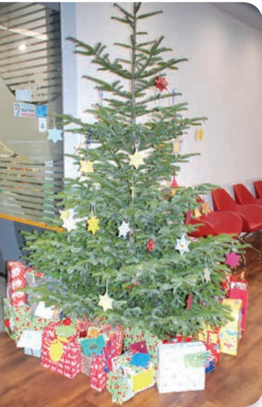
Der 2014er Wunschbaum bei Hörgeräte Jopp & Gerber

Die sympathische Geschäftsfrau engagiert sich für benachteiligte Kinder und Jugendliche in Würzburg und Tschernobyl. Dem SkF Würzburg ist sie seit Jahren verbunden.