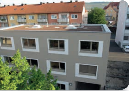
Das neue Wohngruppengebäude

Nach Abschluss des ersten Bauabschnitts im Rahmen der Generalsanierung des Therapeutischen Heims Sankt Joseph konnte im Mai 2014 das neue Wohngruppengebäude in der Wilhelm-Dahl-Straße bezogen werden.